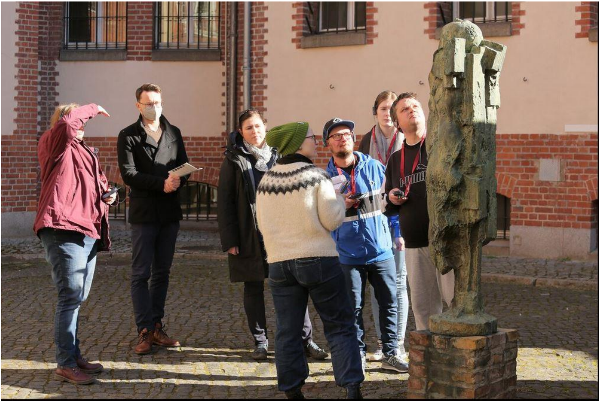
Kostenfreier Audioguide in der Stiftung Gedenkstätte Lindenstraße Downloadlink: https://ibb.co/FqTZvND