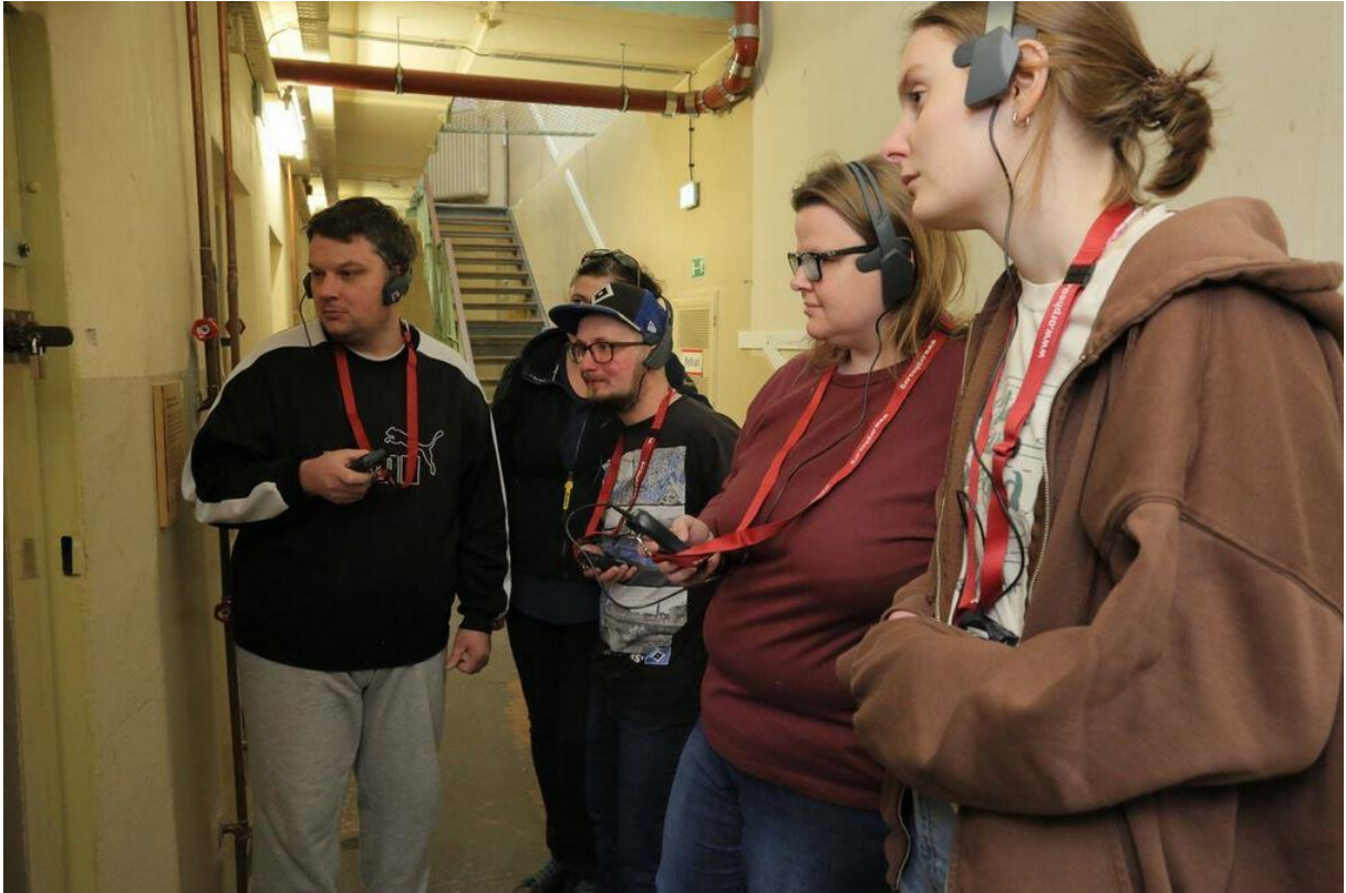
Kostenfreier Audioguide in der Stiftung Gedenkstätte Lindenstraße © Hagen Immel Downloadlink: https://ibb.co/343ZF4b