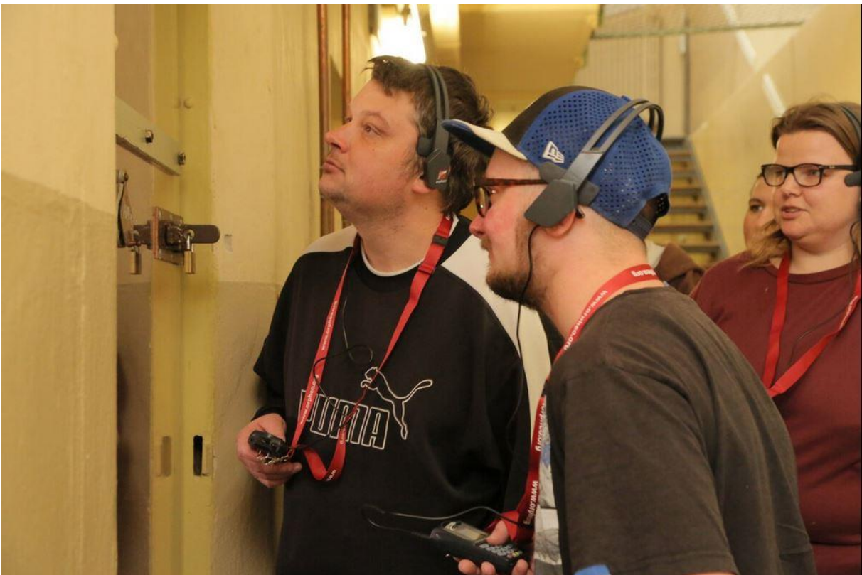
Kostenfreier Audioguide in der Stiftung Gedenkstätte Lindenstraße © Hagen Immel Downloadlink: https://ibb.co/VqGSPwj